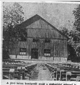
A 1957-ben készült fénykép a szabadtéri színpadról.