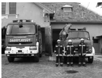
Tisztelettel: Fakan Zoltán t.ü.pk.

dőlt. A kikerülő tűzoltók a személygépkocsiból a súlyosan sérült személyt a mentősöknek átadták. A személygépkocsit áramtalanították majd talpra állították. A nagykorösi tűzoltók szeptember 11-én 14 óra 46 perckor egy perces szirénázással emlékeztek az Amerikában elhunyt tűzoltókra.