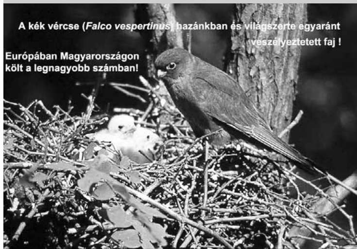
A kék vércse ( Falco tinnunculus ), hazánkban és világszerte egyaránt veszélyeztetett faj!

Európában Magyarországon költ a legnagyobb számban!