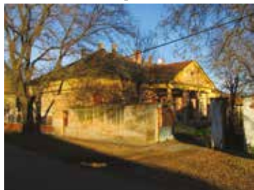
Sigray - Beretvás

Később az épület állami tulajdonban, a szomszédos faipari vállalat – „Pipagyár” – raktáraként hasznosult, majd az Arany János Múzeum próbálta hasonló