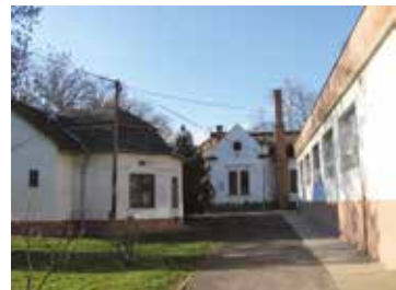
Beretvás János szülőotthon

nulmányaira készülve, iskoláit itt végezte, majd Pesten folytatta. A későbbiekben ügyvédként működött. A politikában az 1848-as szabadságharc idején vállalt szerepet, amikor szülővárosa követeként lett képviselő a nemzetgyűlésben. A következő évben, a Debrecenbe menekült országgyűlésen ő is megszavazta a Habsburg-ház trónfosztását, ezért 1850-ben perbe fogták, és elítélték „felségárulás” miatt. Vagyonekibzása volt a dírekció, és internálás, amit Kőrösön kellett letöltenie. Ez idő alatt a helyi református egyházban kapott számára megfelelő feladatot. Néhány év múlva részesült amnesztiában.