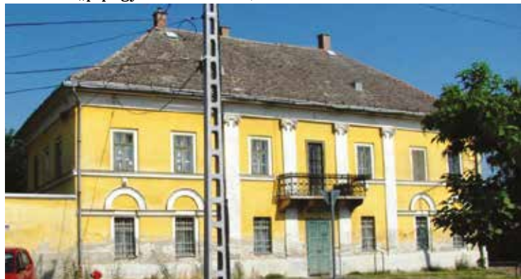
Gaál Dezső kúria

A háború után a helyi kiscigazda párt tulajdonába került. Később ezt is konfiskálták. Előbb a „pipagyár” részeként,