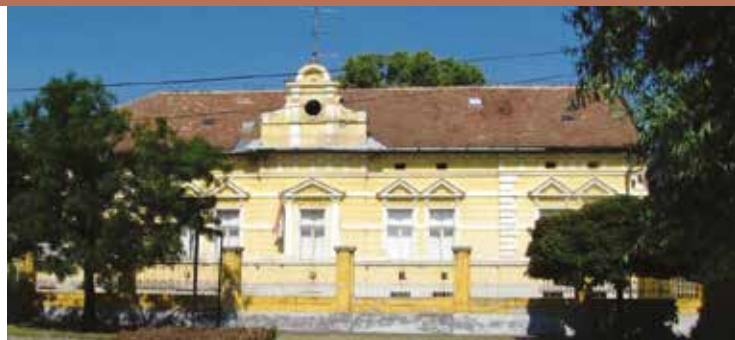
Rákóczi iskola központi épülete

A másik a Szász Károly utca elején, egy egész háztömböt megtöltő telken épült Szalay – kúria története, még az előzőnél is viharosabb, és változatosabb volt. A XIX. század utolsó harmadától Úri Casinóként