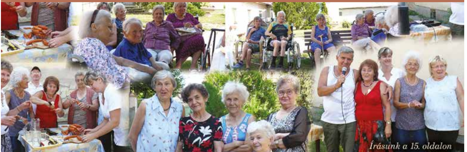
Írásunk a 15. oldalon