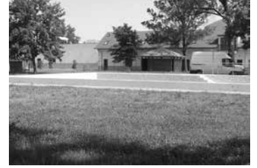
Kiéggett a gyp

támogatóra lelt a város önkormányzatában. Még annyit sem mondtak: Enyje-bejnye Tiborom... Végre meg kellene nyitni. –