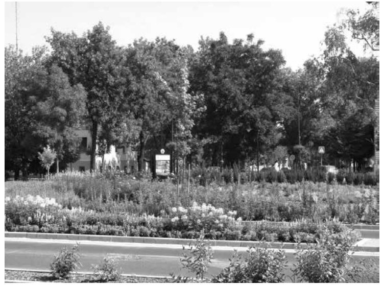
Ide kerülne a nemzetzászló