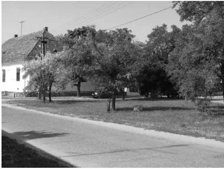
1946-ig itt volt az országzászló