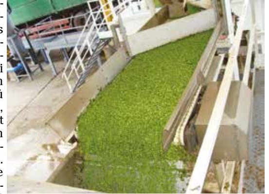
Borsószem tisztítás a Kecskeméti Konzerv Kft-nél.

Milyen eredményeket várnak a fejlesztésektől?