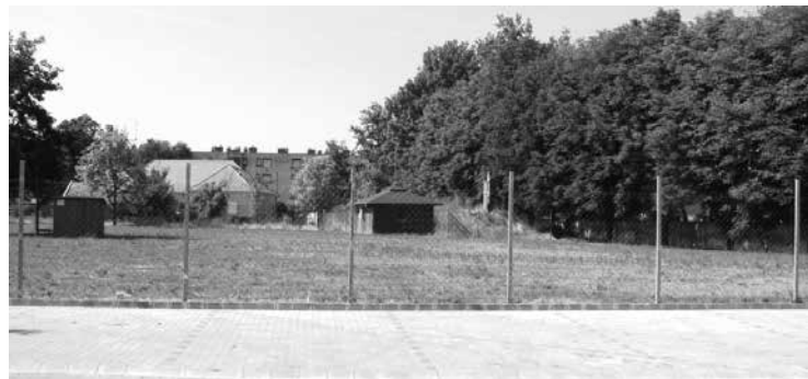
A kerítésen belül nincs élet