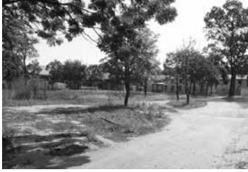
„Szép” ápolit a strand parkolója

Nagykőrös. Mielőtt a témára kanyarodnánk, érdemes néhány percet szánni a város mindmáig „egyetlen és hiteles” sajtótermékének