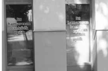
Már négy éve tart a hamarosan

Az ÖH hírei csupa sikertörténetről regélnek! Semmi fiaskó! Oly sikeres volt a