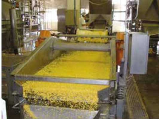
Kukoricaszemek szelektálása, vibrációs síkszelektoron.

A Kecskeméti Konzervgyár Kft-nek mintegy nyolcvan nagykőrösi alkalmazottja van, létszámuk a szezonban a százat is eléri, így hozzájárul a nagykőrösi munkanélküliség gondjainak csökkentéséhez. Önök az alábbiakban a Petőfi Népe című lapban megjelent írást olvashatják.