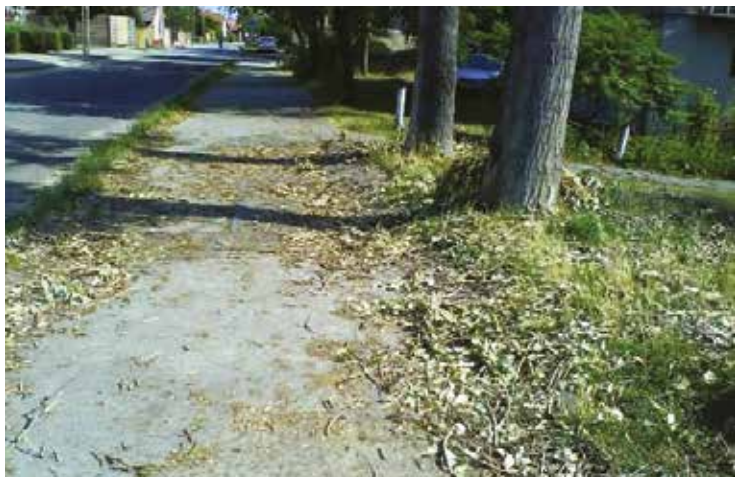
Tájkép csata után- Gallyaztak, de nem tettek maguk után rendet, írja szomorúan Olvasónk