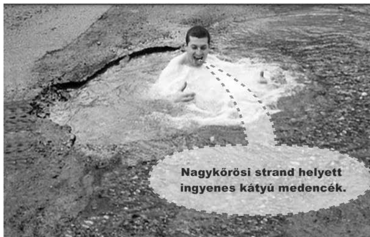
Nagykörösi strand helyett ingyenes kátyú medencék.