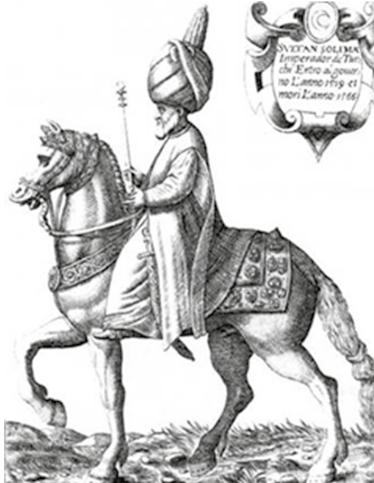
Szulejmán korabeli rézmetszeten

Budát és ezzel évszázadokra megszûnt az önálló magyar