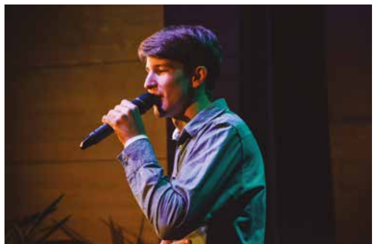
erdélyi magyar énekes, a Csillag születik 3. szériájának győztese szórakoztatta a közönséget.