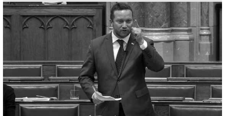
A Képviselő a következőket írta: