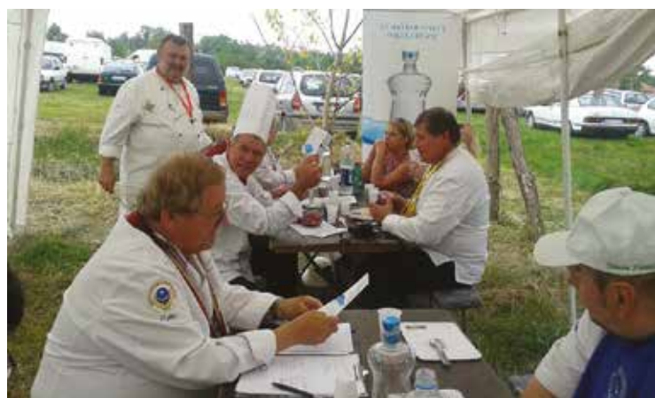
Zsűrizés a Nemzetek Főzöverseyén

ban áll, támogassam, lehetőség szerint juttassunk nekik valami adományt. Augusztusban találkozunk a lovagtársainkkal Szímőn, és mindenképpen megbeszéljük, hogy miként tudunk se-