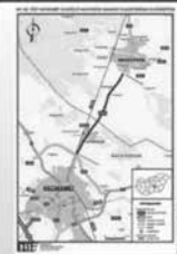
Strapabíróbbá válhat a Nagykőrösti Kecskeméti összekötő útszakasz

11.3. számú településhatár: 1016/1-441-es Kálvin téri elkerülő-Nagykőrösi összekötő. A fejlesztés célkitűzése, valamint a közművek áthelyezése, az engedélyezés és a kiváltó terv elkészítése a 2017. évi. a településhatár felújításáról szóló 11.3. számú önkormányzati határozat alapján történt. A kb. 30 lakosú borsosgyári településen a közlekedési zaj elviselhetetlenségét okozó teherautó forgalomra kell majd számítani. A fejlesztésnek köszönhetően még több autót, ráadásul teherautó forgalomra kell majd számítani. A Kecskeméti úton már eddig is óriási zajt kellett elviselnie az ott élőknek. És még csak nem is a zaj a legnagyobb probléma! Egy-egy nagyobb teherautó, kamion ha elhalad, szabályosan beleremeg a ház. Egyik olvasónk elhívott, hogy tapasztaljam meg magam is. Kb. 1 óra hosszát töltöttem el Nála, és döbbenet konst-