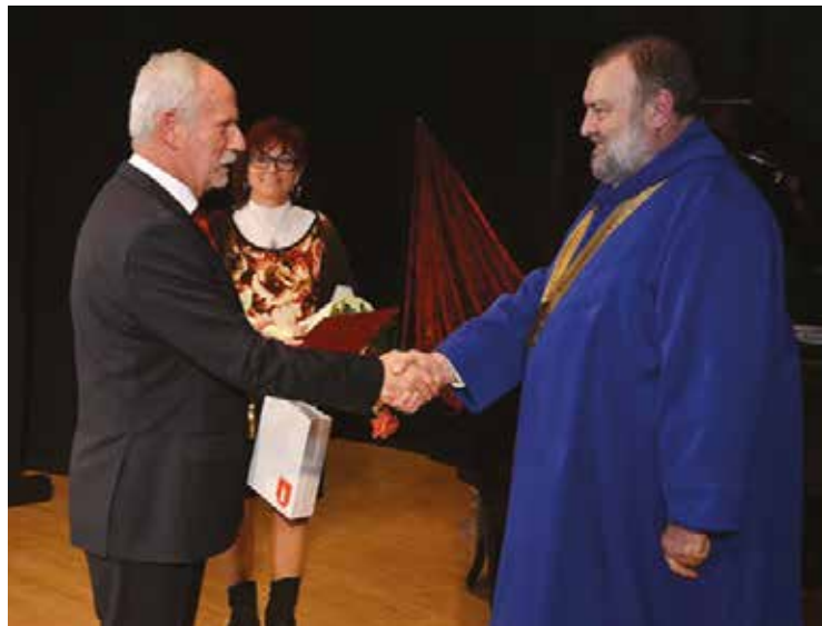
Díszpolgári cím átvétele Szímőn

gíteni. Hiszen egy lovagrendek – pláne aminek én vagyok a vezetője és alapító nagymestere – mindenképpen a legfontosabb