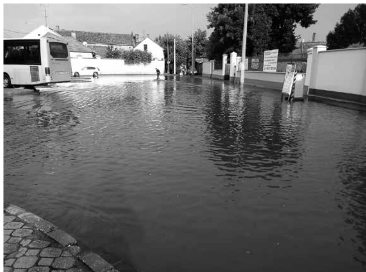
Nagykorös győzött! A strand ugyan zárva, de itt van helyette Velence...