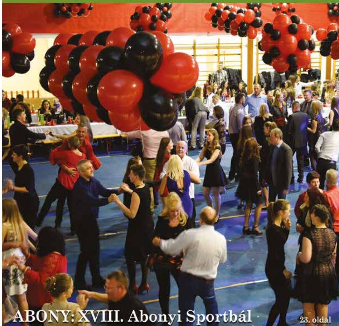
ABONY: XVIII. Abonyi Sportbál

Nagykőrös - Abony - Csemő - Jászkarajenő - Kocsér - Körösetetlen - Nyársapát - Törtel