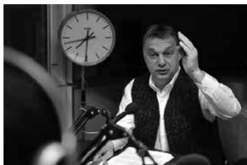
A magyar választó azért mégis csak hisz-e?

A magyar ember kezdi elhinni, hogy ez a hatalom tényleg hosszú időre rendezkedik be ebben az országban. Az egypárti, rendszerváltás előtti diktatúrát (MSZMP) mára felváltotta a szintén egypárti, és Orbán szerint egypólusú, de szerinte „demokratikus” berendezkedés.