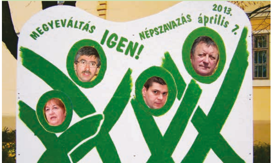
A témával kapcsolatban olvasói vélemények, írások internetes oldalunkon: www.hetihirek.hu