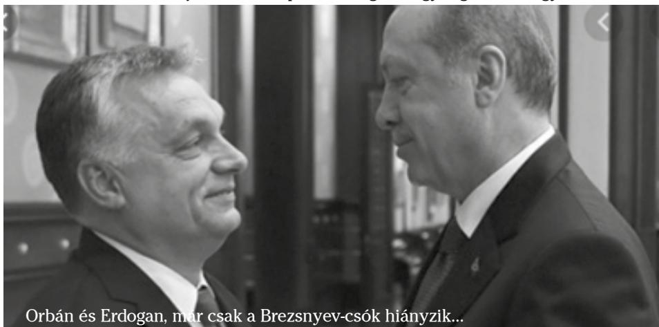
Orbán és Erdogan, már csak a Brezsnyev-csók hiányzik...

Elvileg a szír menekültek visszatelepítése hazájukba minden európai ország érdeke, de ez egyik államvezetőnél se jelenti azt, hogy ezután parolázzon Erdogan. Mégkevésbé, hogy fogadja is ünnepeles keretek között, mint ahogy Orbán fogja november 7-én. Az európai vezetők megdöbbennek, amikor Orbán a vétőjával egyedülként megakadályozta,