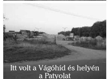
Itt volt a Vágóhíd és helyén a Patyolat

Ugyanis a két utóbbit az alapokig elbontották, a törmelékét