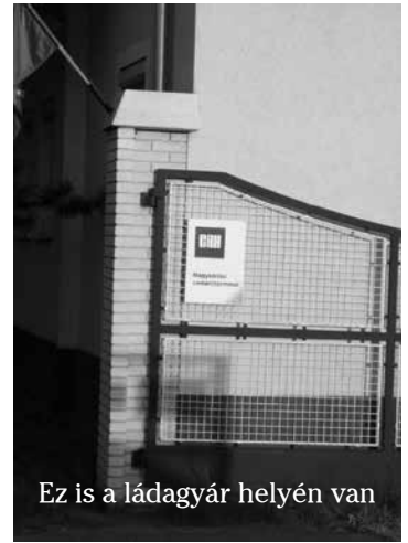
Ez is a ládagyár helyén van