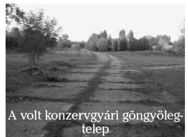
A volt konzervgyári göngyölegtelep