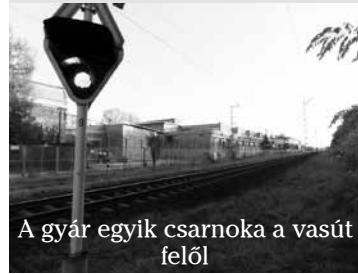
A gyár egyik csarnoka a vasút felől

Lapunk is úgy gondolja, hogy ideje lenne szembesíteni nem csak dr. Czira Szabolcsot, hanem a testület többségi oldalán ülő képviselőket, mit is jelent a krónikus hazugság: „Vállalkozó-barát város” szlogen?