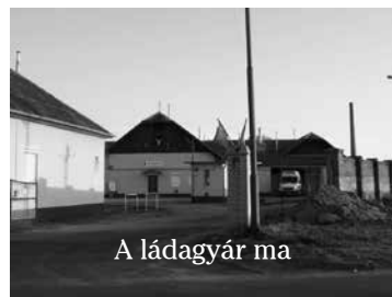
A ládagyár ma