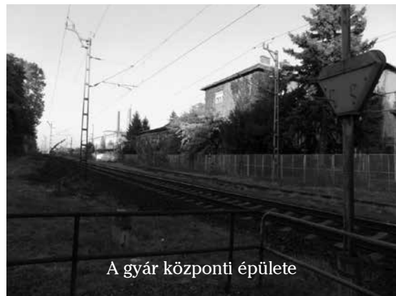
A gyár központi épülete

elhordták! Se híre, se hamva egyiknek sem!