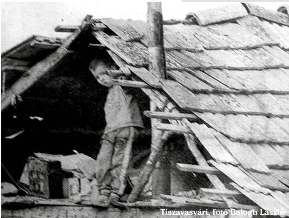
Tiszavasvári, fotó Balogh László

Sok egyéb ügy is van, ami nyíltan ellentmond a Fi-