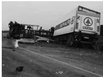
Fotó: PMKI Cegléd http

Kamion pótkocsijának ütközött egy kisbusz péntekre virradóra a 4-es főút 68-as kilométerénél, Cegléd közelében. A buszban tizenhatan utaztak, az ütközés következtében az egyikük a helyszínen elhunyt, egy ember pedig súlyos sérüléseket szenvedett. A ceglédi hivatásos tűzoltók áramtalanították és átvizsgálták a járműveket, majd biztosították a helyszínt. A műszaki mentés ideje alatt az érintett útszakaszt lezárták, a forgalmat elterelték.