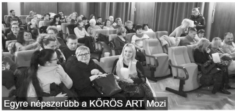
Egyre népszerűbb a KÖRÖS ART Mozi

A Nagykőrösi Arany János Kulturális Központ 2018-as szakmai beszámolójából kiderül, hogy a 2018. január 1 - 2018. december 31-i időszakban összesen 423 alkalommal vetítették, 112 filmet és mesét vegyesen, melyekre összesen 4809 db jegyet értékesítettek.