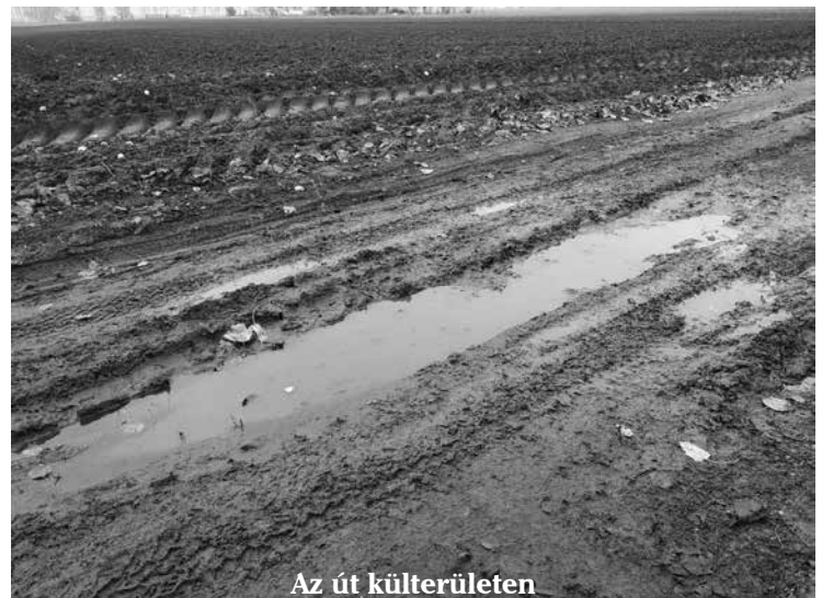
Az út külterületen