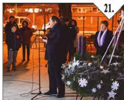
Abony: Adventi gyertyagyújtás