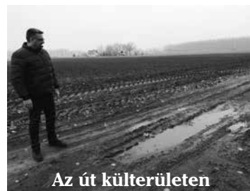
Az út külterületen