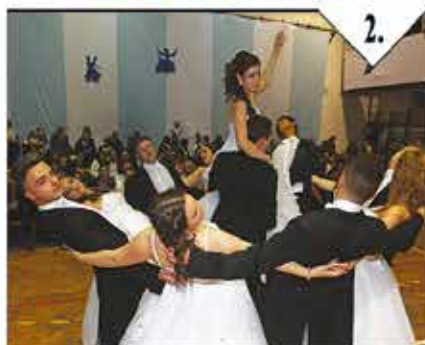
Szalagtűző a Toldiban