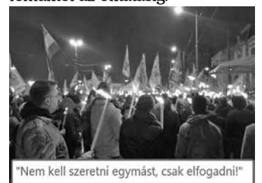
„Nem kell szeretni egymást, csak elfogadni!”

az elvándorlástól a korrupt földosztásig, az egészségügyi problémáktól az oktatásig.”