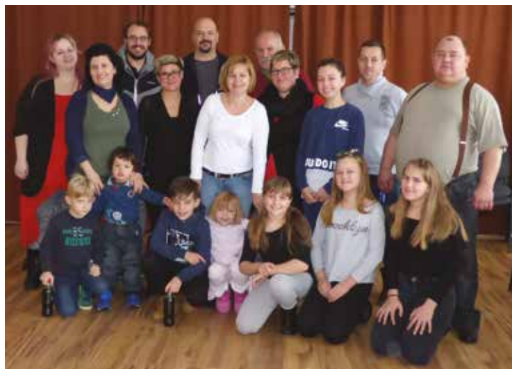
A nagykőrösi „delegáció”

A Körtánc Egyesület – Kőrszínház és Szímő község kiváló több