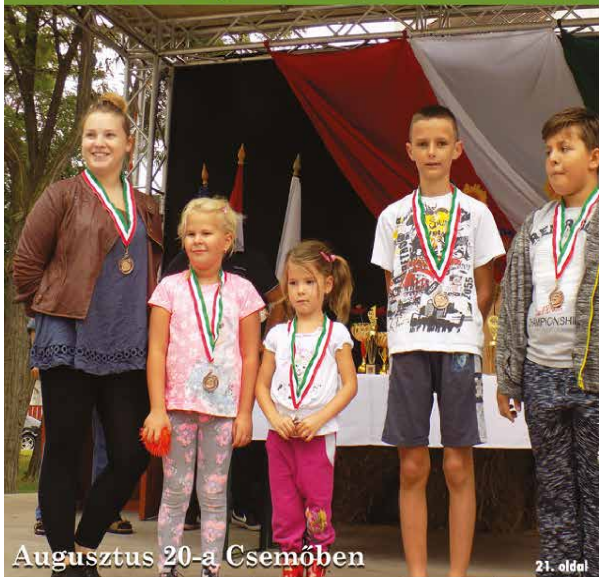
Augusztus 20-a Csemőben

Nagykőrös - Abony - Csemő - Jászkarajenő - Kocsér - Körösetetlen - Nyársapát - Törtel