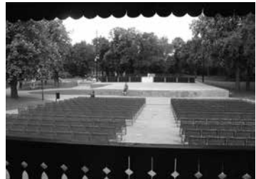
Nagykörös zöld szíve

Elhangzott, hogy a Norvég Alaptól nyert 94 millió 36 ezer forintot a város kiegészíti 115 millióval. Majd az idén, nem sokkal a remélt befejezés előtt nyert 18 millió pályázati összeggel, közel negyedmilliárdba kerül