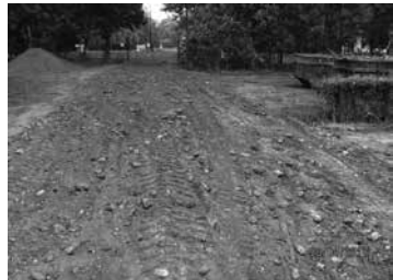
Az egyik bejárat

Ez a helyi, hivatalos „tömeg-tájékoztatósi gyakorlat” egy