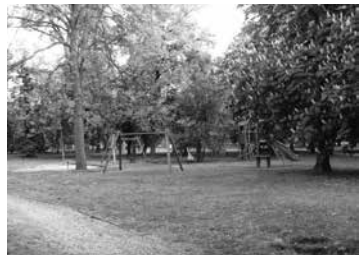
A tízéves játszópark

Nem volt meglepetés, hogy az ÖH – Önkivületi Hírek – hirdedett főszerkesztője (LV) világgá kürtölte a Cifrakert múlt