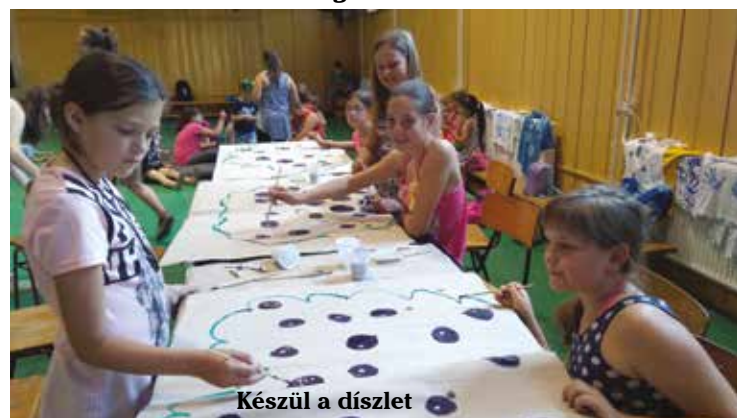
Készül a díszlet

A Crown Magyarország Kft. nagykőrösi telephelyére az alábbi pozíciókba keres munkatársakat