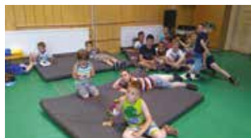
A fiúk keményen gondolkodnak