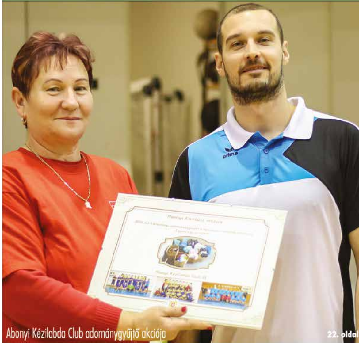
Abonyi Kézilabda Club adománygyűjtő akciója

Nagykőrös - Abony - Cegléd - Csemő - Jászkarajenő - Kocsér - Körösetetlen - Nyársapát - Törtel