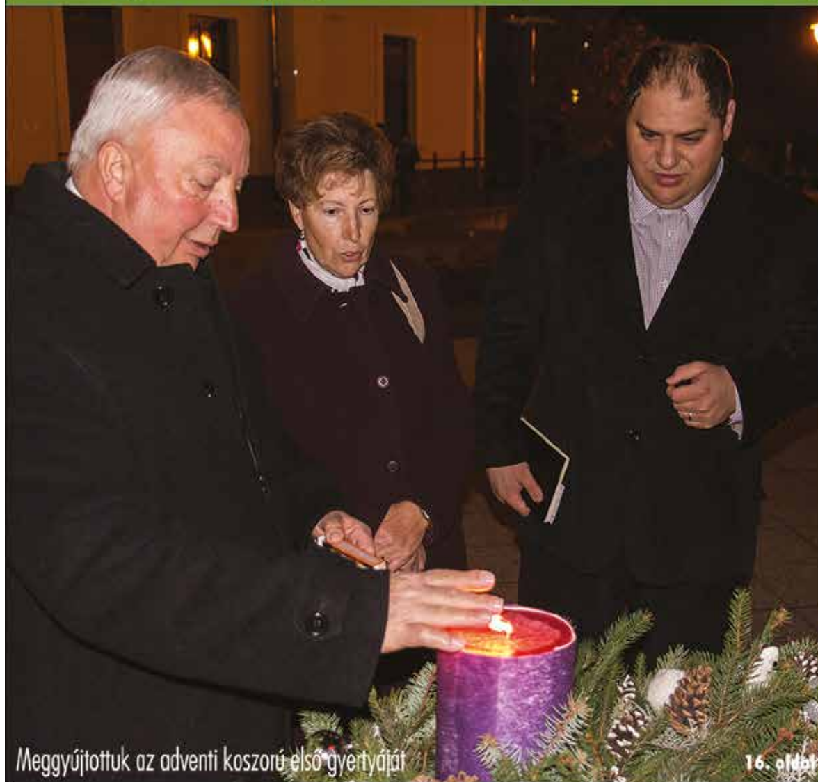
Meggyújtottuk az adventi koszorú első gyertyáját

Nagykőrös - Abony - Cegléd - Csemő - Jászkarajenő - Kocsér - Körösten - Nyársapát - Törtel