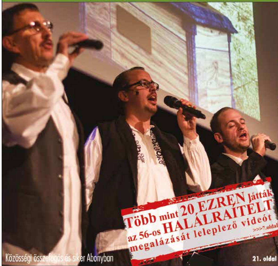
Közösségi összefogás és siker Abonyban

Nagykőrös - Abony - Cegléd - Csemő - Jászkarajenő - Kocsér - Körösetetlen - Nyársapát - Törtel