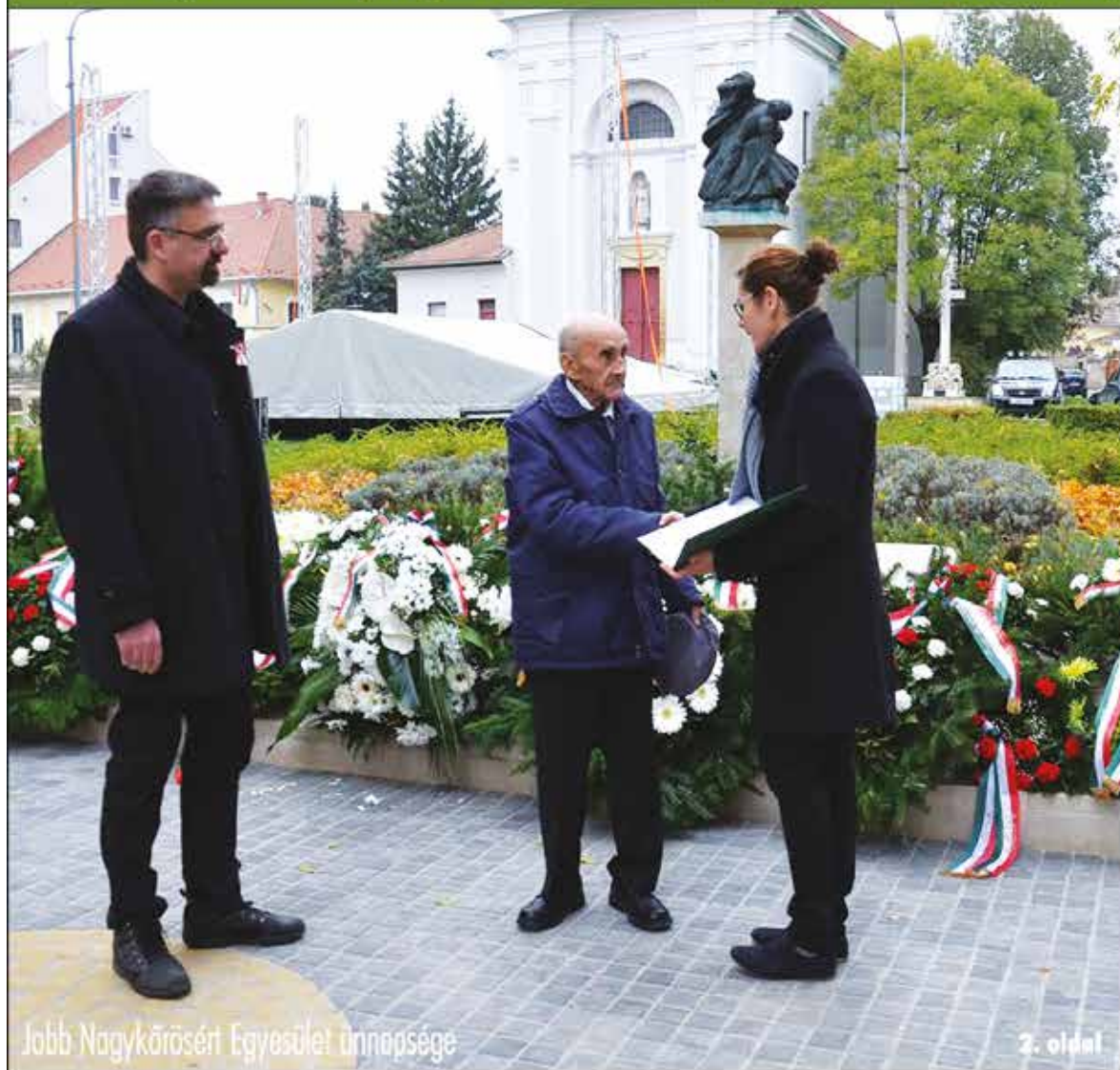
Jobb Nagykőrösért Egyesület ünnepsége

Nagykőrös - Abony - Cegléd - Csemő - Jászkarajenő - Kocsér - Körösetetlen - Nyársapát - Törtel