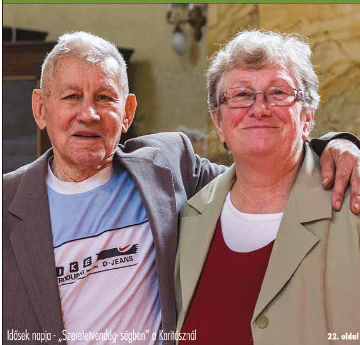
Idősek napja - „Szeretelvendég- ségben” a Karitáznál

Nagykőrös - Abony - Cegléd - Csemő - Jászkarajenő - Kocsér - Köröstetétlen - Nyársapát - Törtel