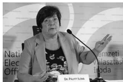
Pálffy Ilona, a Nemzeti Választási Iroda elnöke

(98,13%). Cegléden, a választókerületi központban 40,7% ér