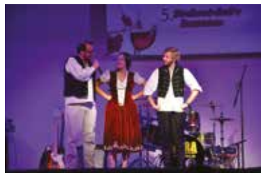
/Folytatás a 3. oldalról/

Az idén a Fröccsnapokon 216 liter fröccsöt készítettek el a Magyarországi Szikvizgyártók