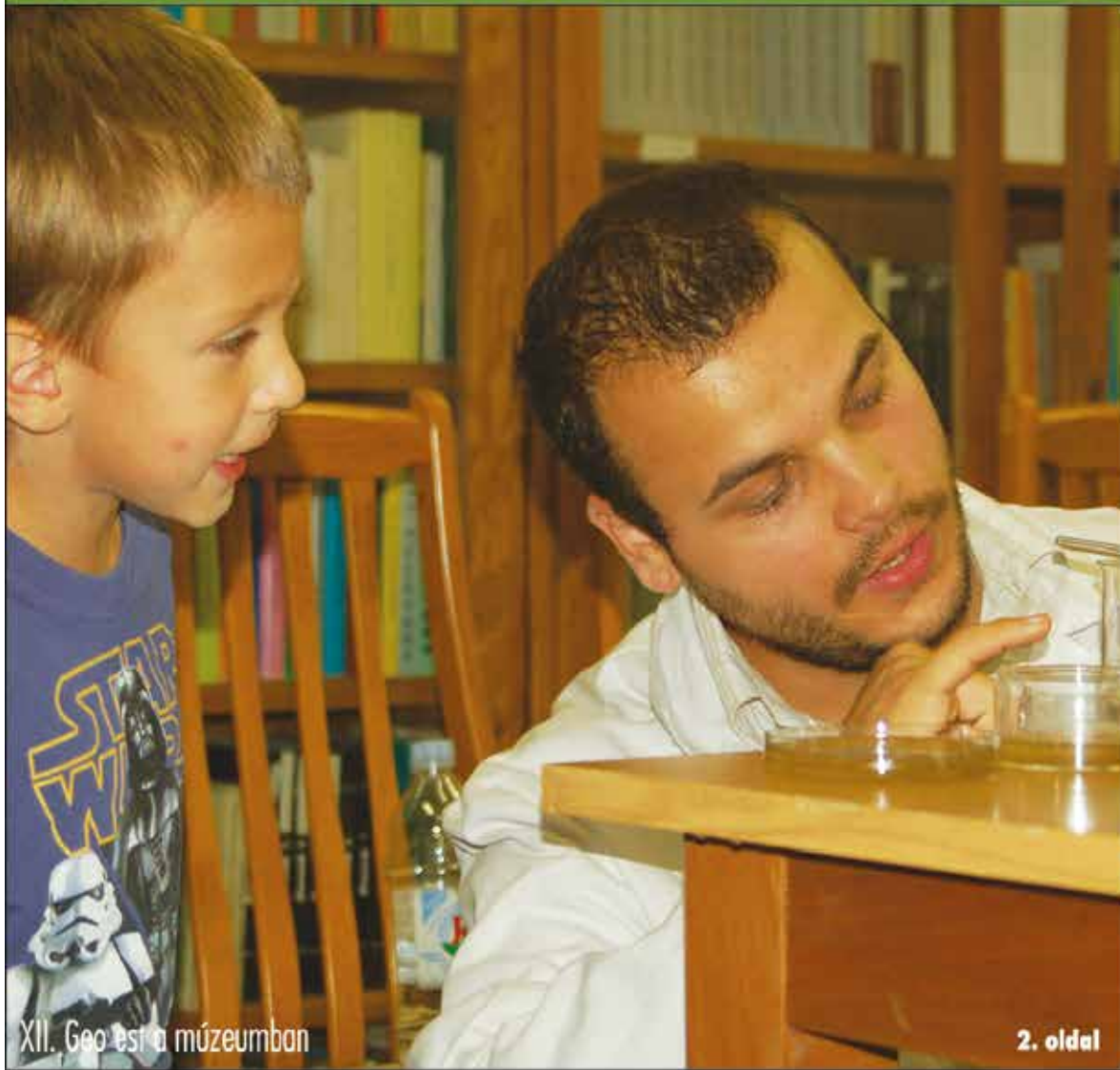
XII. Geo est a múzeumban

Nagykőrös - Abony - Cegléd - Csemő - Jászkarajenő - Kocsér - Körösetetlen - Nyársapát - Törtel