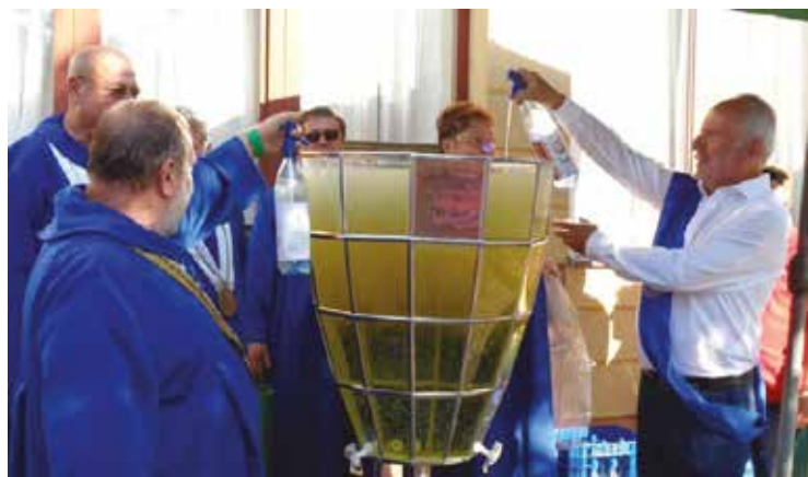
Jedlik Ányos Lovagrendjének barátság poharában.

A kaméleonemberek (legyen az politikus, újságíró, hivatalve-