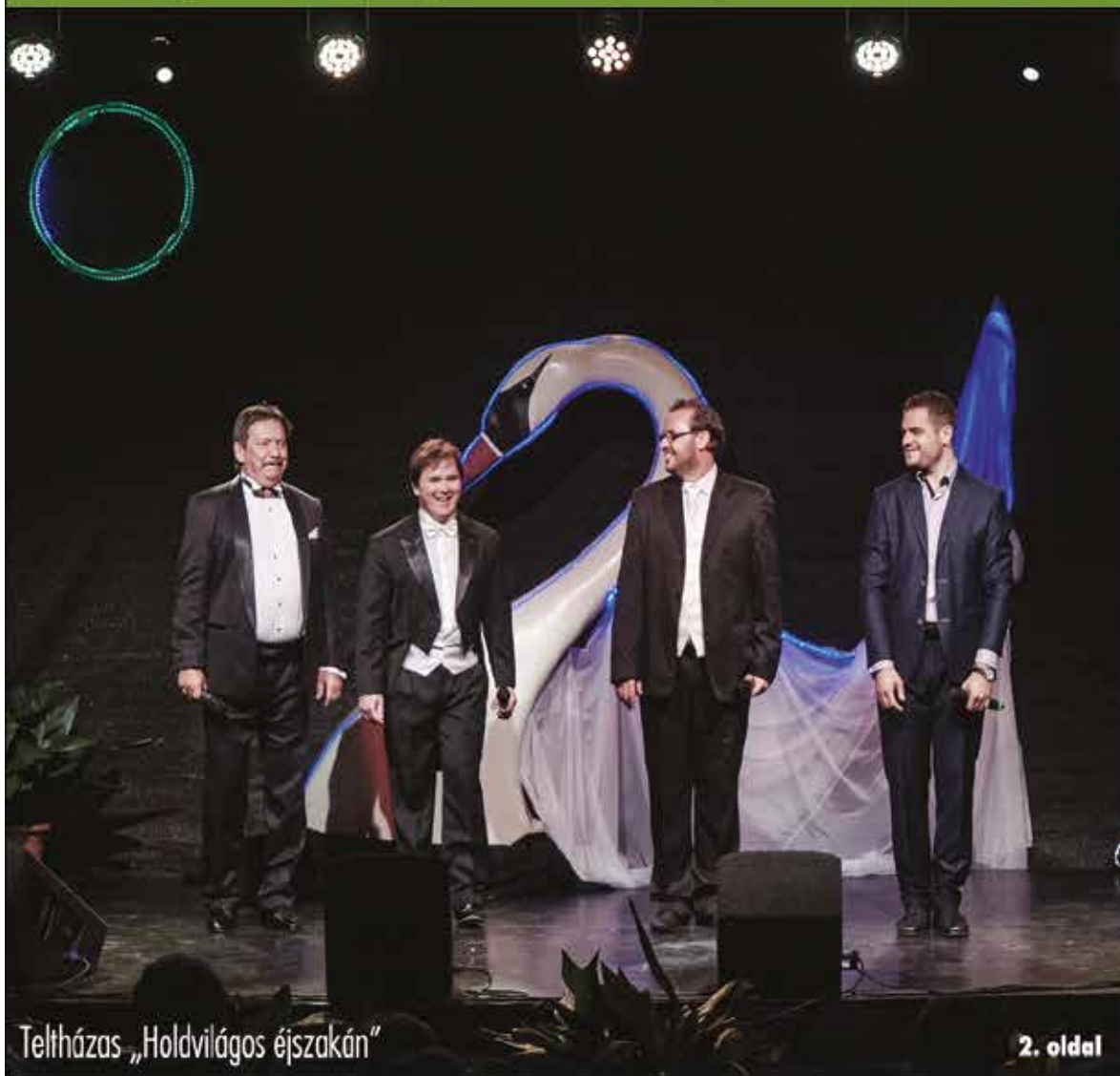
Teltházas „Holdvilágos éjszakán”

Nagykőrös - Abony - Cegléd - Csemő - Jászkarajenő - Kocsér - Körösetetlen - Nyársapát - Törtel