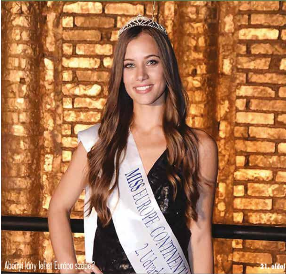
Abonyi lány lehet Európa szépe?

Nagykőrös - Abony - Cegléd - Csemő - Jászkarajenő - Kocsér - Körösetetlen - Nyársapát - Törtel