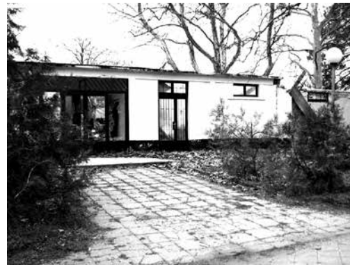
Bontás előtt: 2008. április

A válság utáni néhány béke-év sem tette lehetővé, a strand tervezett fejlesztését. A fedett, termálvízzel ellátott fürdő nem valósult meg, sem a háború előtt, sem utána.