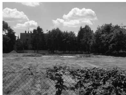
Ennyi maradt: 2008. július

A háború különösebb károkat nem okozott igaz, hogy '45-ben „civiliek” – a város lakossága - nem léphettek be. Kizárólag a szovjet katonák, és a strand személyzete.