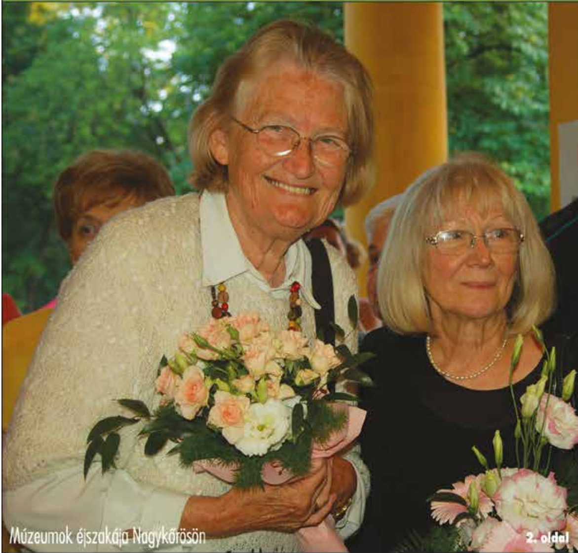
Múzeumok éjszakája Nagykőrösön

Nagykőrös - Abony - Cegléd - Csemő - Jászkarajenő - Kocsér - Körösten - Nyársapát - Törtel