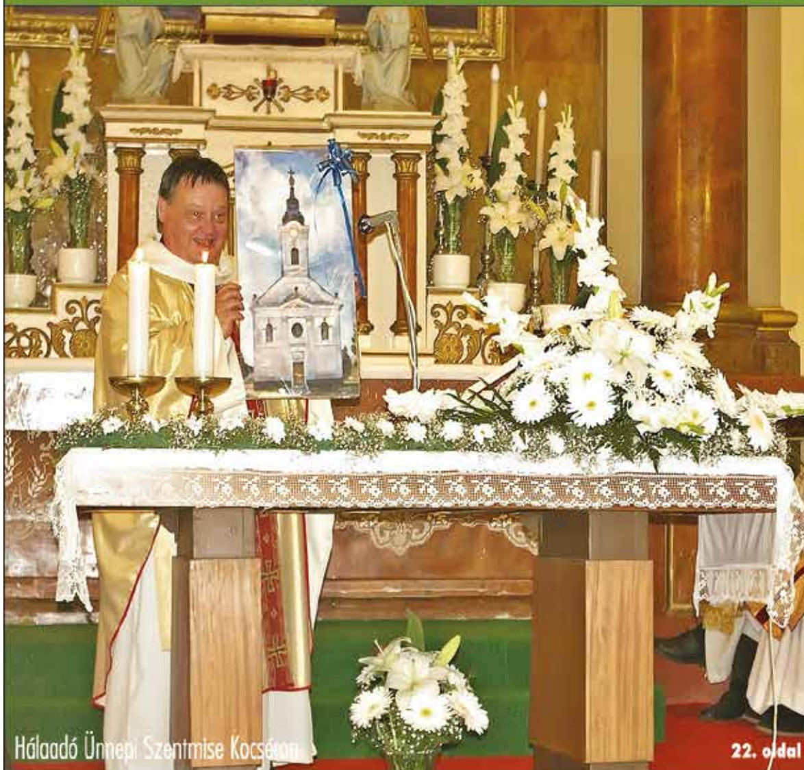
Hálaadó Ünnepi Szentmise Kocséran

Nagykőrös - Abony - Cegléd - Csemő - Jászkarajenő - Kocsér - Körösetetlen - Nyársapát - Törtel