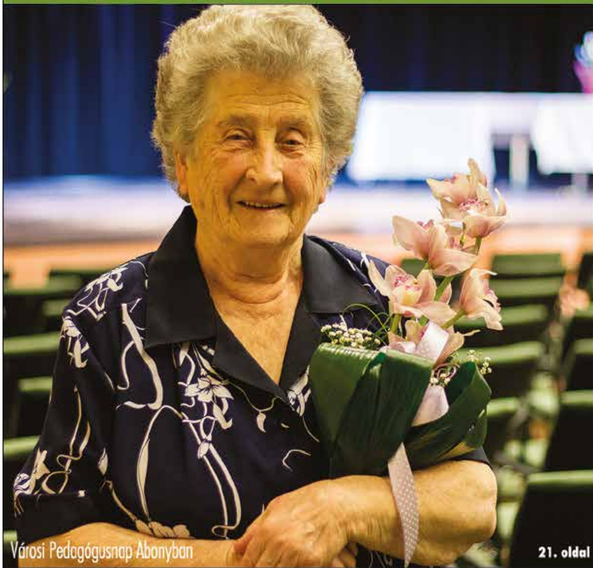
Városi Pedagógusnap Abonyban

Nagykőrös - Abony - Cegléd - Csemő - Jászkarajenő - Kocsér - Körösetetlen - Nyársapát - Törtel