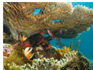
Ras Mohhamed korallzátony Egyiptomban

gát Róbert, a rá jellemző remek humorral mutatta be. A szudáni mocsarak világa, a sajátos településszerkezet mindannyiunkat meglepett. A Fehér-Nílus példájára egy afrikai bennszülött fehérre meszelt arcát láthattuk, mely megmutatta a folyó hordalékát és annak pozitív hatását az egészségre. Eritrea nagyon szegény ország, ennek ellenére gyönyörű tengerpartjai vannak és kivételes természeti értékekkel bír. Szenegálban a Lac Rose nevű tó látványa mindenkét ámulatba ejtett. Hihetetlen, hogy, egy ilyen rózsaszín állóvíz, hogy lehet teljesen természetes. Gambia méltán lehet