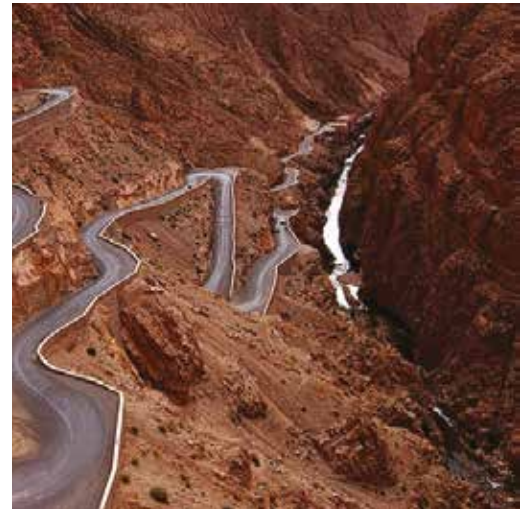
Todra-folyóvölgy és a mellette futó autótút Marokkóban

alkalommal megdöbben, hogy legyen szó földrajzról, geológiáról, anatómiáról, pszichológiáról, csillagászatról, gasztró, vagy valláskultúráról, nyelvészeti kérdésekről, vagy bármiről, mindenben jártas. Tisztában van ez a város vele, hogy mekkora érték van a kezünk