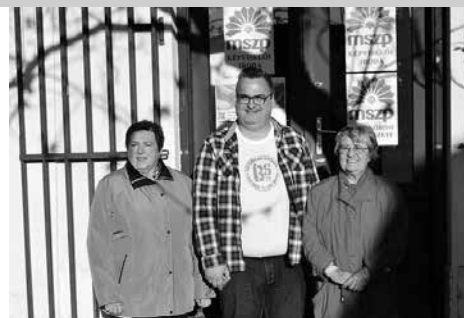
MSZP Nagykőrösi Szervezete