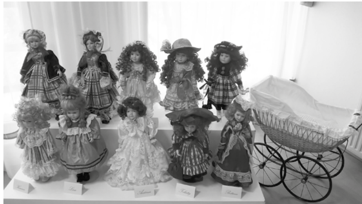
Az aktuális babakiállítás fotói