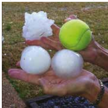
Extrém jégeső Amerikában

Nagy meglepetést okozott a látogatók köreiből, hogy a levegő összetétele nem csupán az iskolában megismert gázokból áll, hanem számos szilárd, sőt