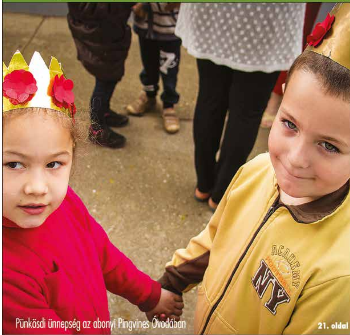
Pünkösti ünnepség az abonyi Pingvines Óvodában

Nagykőrös - Abony - Cegléd - Csemő - Jászkarajenő - Kocsér - Körösetetlen - Nyársapát - Törtel