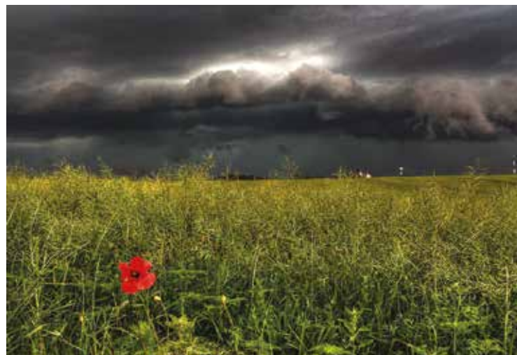
Pécsi zivatarfelhők 2012-ben

Az est talán legszebb képei és videói a sarki fény jelenségéhez kapcsolódtak, ahol az érdeklődők több nézőpontból is láthatták a jelenség káprázatos felvételeit a jellegzetes színjátásáról híres jelenségekről. Az atmoszféra tömege szintén meglepő eredményt mutatott, mely a korábban ismertett adatokkal jól egybeesett. A sűrűség és nyomás vizsgálatánál a léghajók, a repülés, az úszás