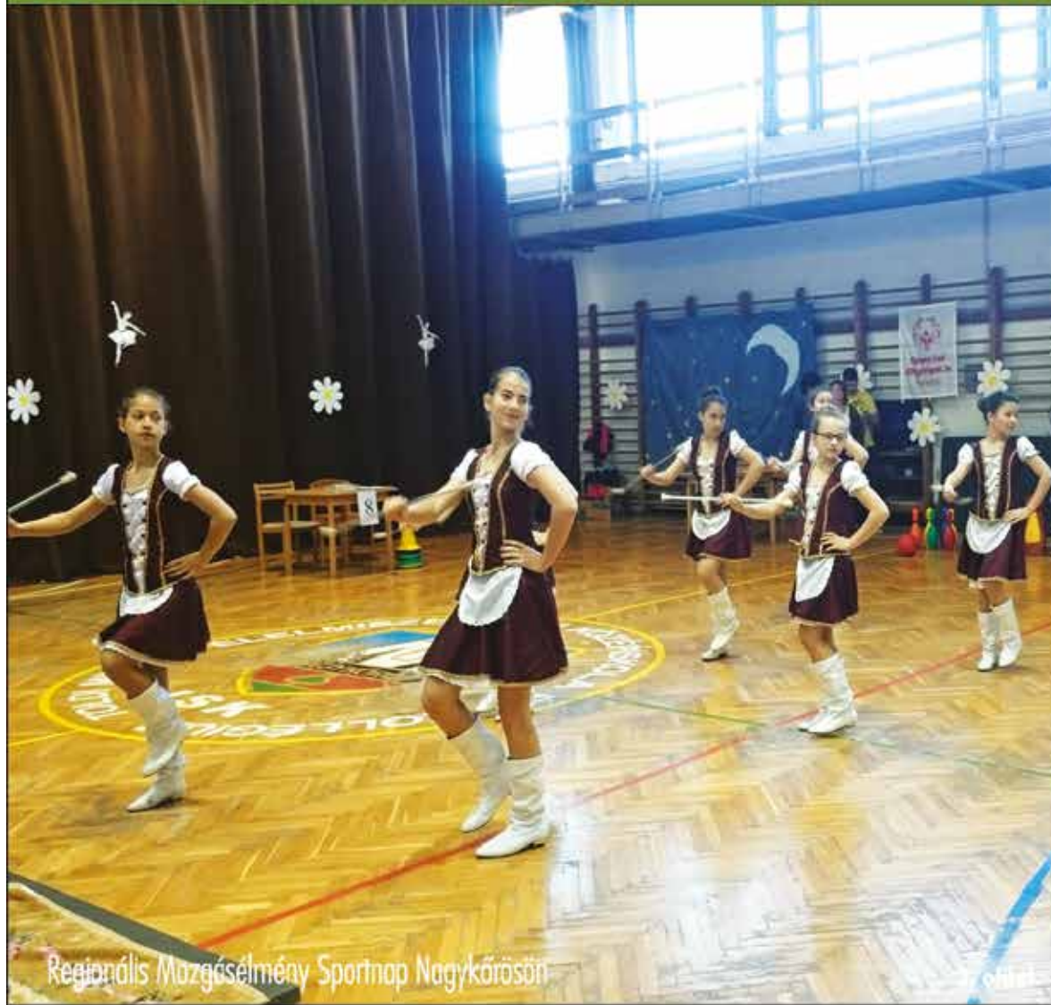
Regionális Mozgásélmény Sportnap Nagykőrösön

Nagykőrös - Abony - Cegléd - Csemő - Jászkarajenő - Kocsér - Körösetetlen - Nyársapát - Törtel