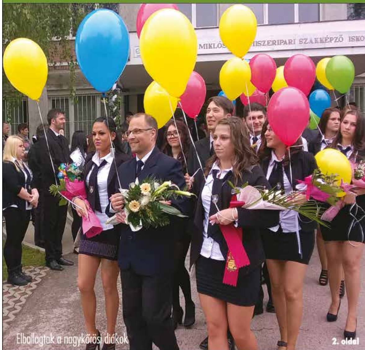
Elballagtak a nagykőrösi diákok

Nagykőrös - Abony - Cegléd - Csemő - Jászkarajenő - Kocsér - Körösetetlen - Nyársapát - Törtel