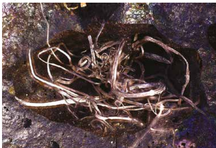
Szálas ezüst halmaz Németországból

Bolíviától Japánig, New Yorktól Ausztráliáig, Kanadától Szibériáig. Az estét a vendégek elismerő szavai koronázták meg, melyek közül a számomra az egyik legkedvesebb a következő volt: „...soha nem szerettem a kémiát, ez egy borzalmas dolog volt a gyermekkoromban, de ma este rájöttem, hogy