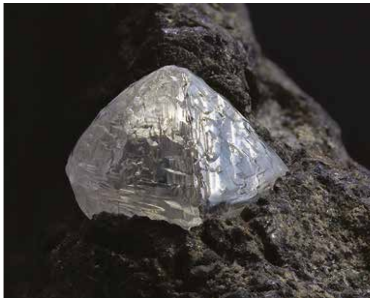
Gyémánt Dél-Afrika híres bányáiból

Ezen osztályban a másik nagy csoportunk a kén-szelén-tellúr volt, melyből a kén a legjelentősebb anyag, amely önmagában igen sok alakú megjelenésben fordul elő. A jellegzetes sárga