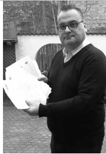
MSZP Nagykörösi Szervezete