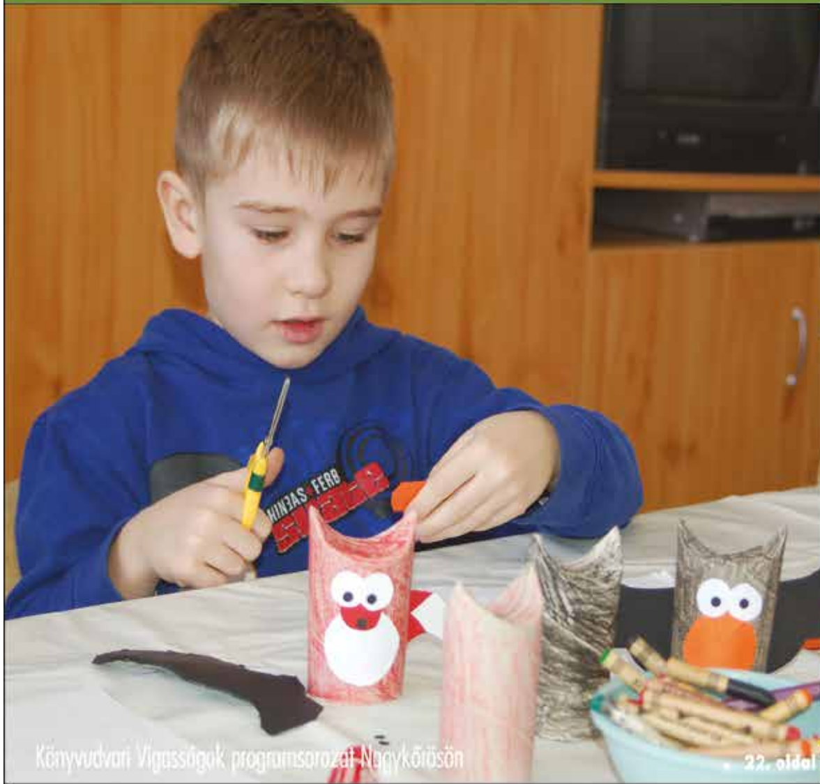
Könyvtudvari Vigasságok programsorozatai Nagykőrösön

Nagykőrös - Abony - Cegléd - Csemő - Jászkarajenő - Kocsér - Körösten - Nyársapát - Törtel