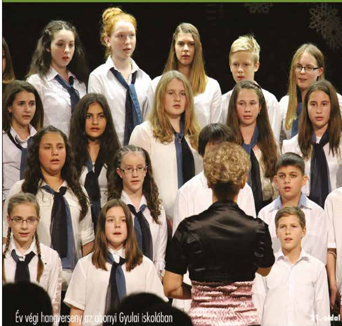
Év végi hangverseny az abonyi Gyulai iskolában

Nagykőrös - Abony - Cegléd - Csemő - Jászkarajenő - Kocsér - Körösten - Nyársapát - Törtel