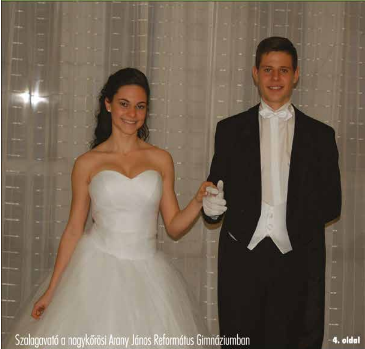
Szalagavató a nagykőrösi Arany János Református Gimnáziumban

Nagykőrös - Abony - Cegléd - Csemő - Jászkarajenő - Kocsér - Körösetetlen - Nyársapát - Törtel