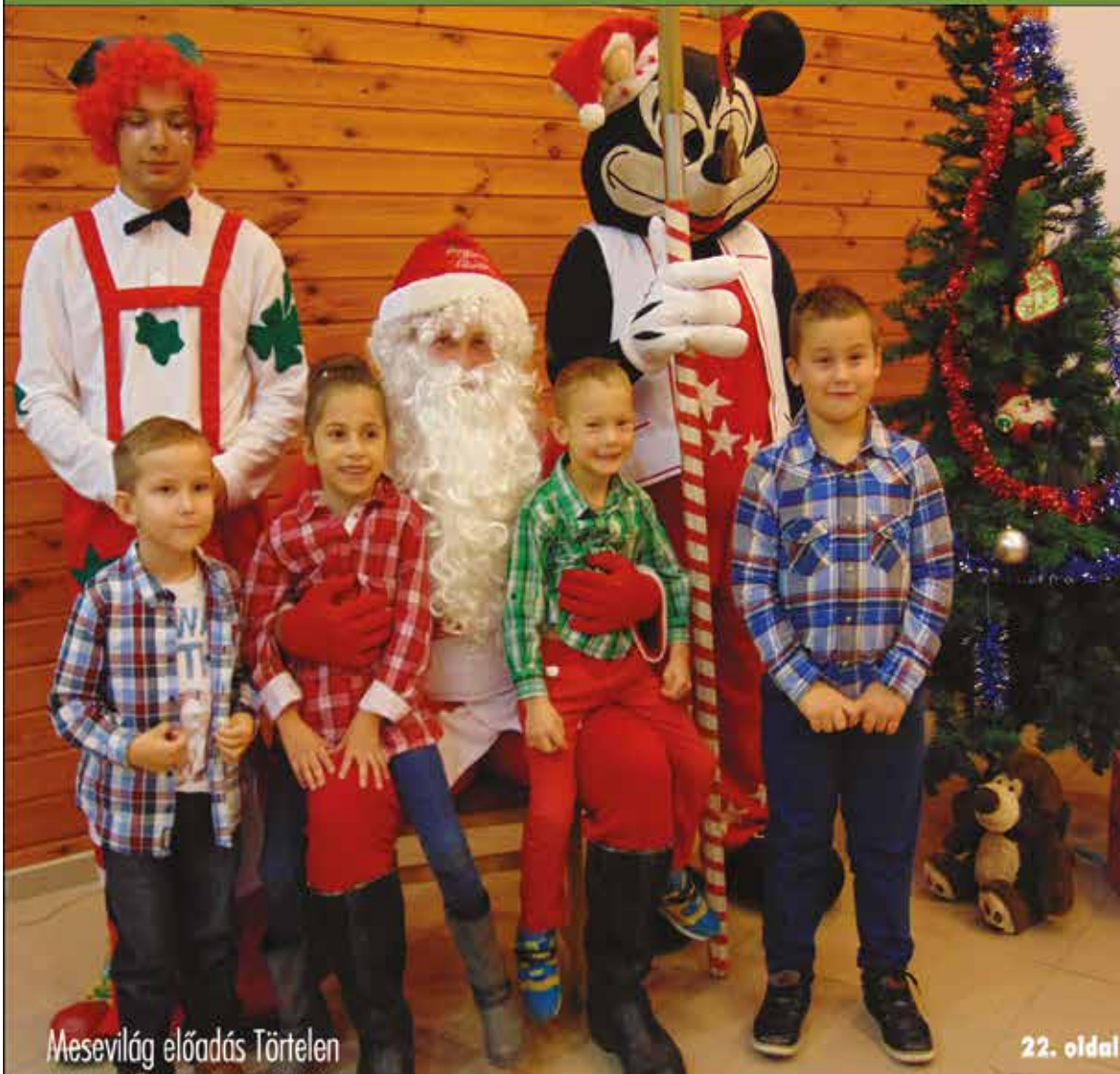
Mesevilág előadás Törtelen

Nagykőrös - Abony - Cegléd - Csemő - Jászkarajenő - Kocsér - Köröstetétlen - Nyársapát - Törtel