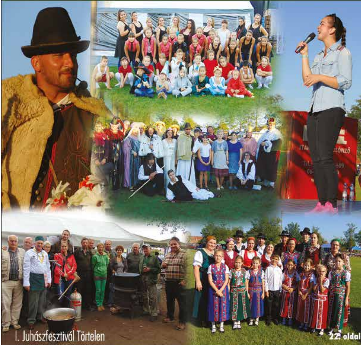
I. Juhászfesztivál Törtelen

Nagykőrös - Abony - Cegléd - Csemő - Jászkarajenő - Kocsér - Körösetetlen - Nyársapát - Törtel