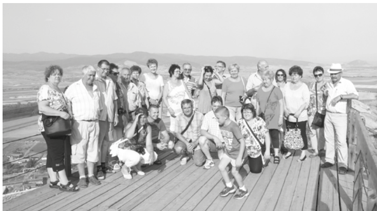
Dél-Erdélyben járt a Nagykőrösi Ipartestület

Egy nyugdíjas olvasójuk (Név és cím a Szerkesztőségben)