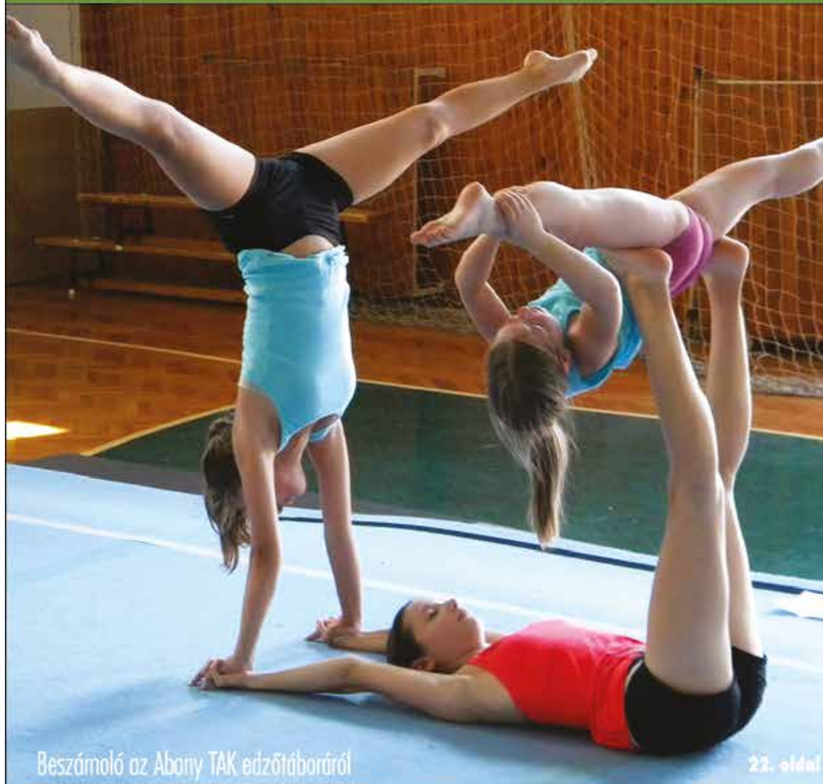
Beszámoló az Abonyi TAK edzőtáboráról

Nagykőrös - Abony - Cegléd - Csemő - Jászkarajenő - Kocsér - Körösetetlen - Nyársapát - Törtel