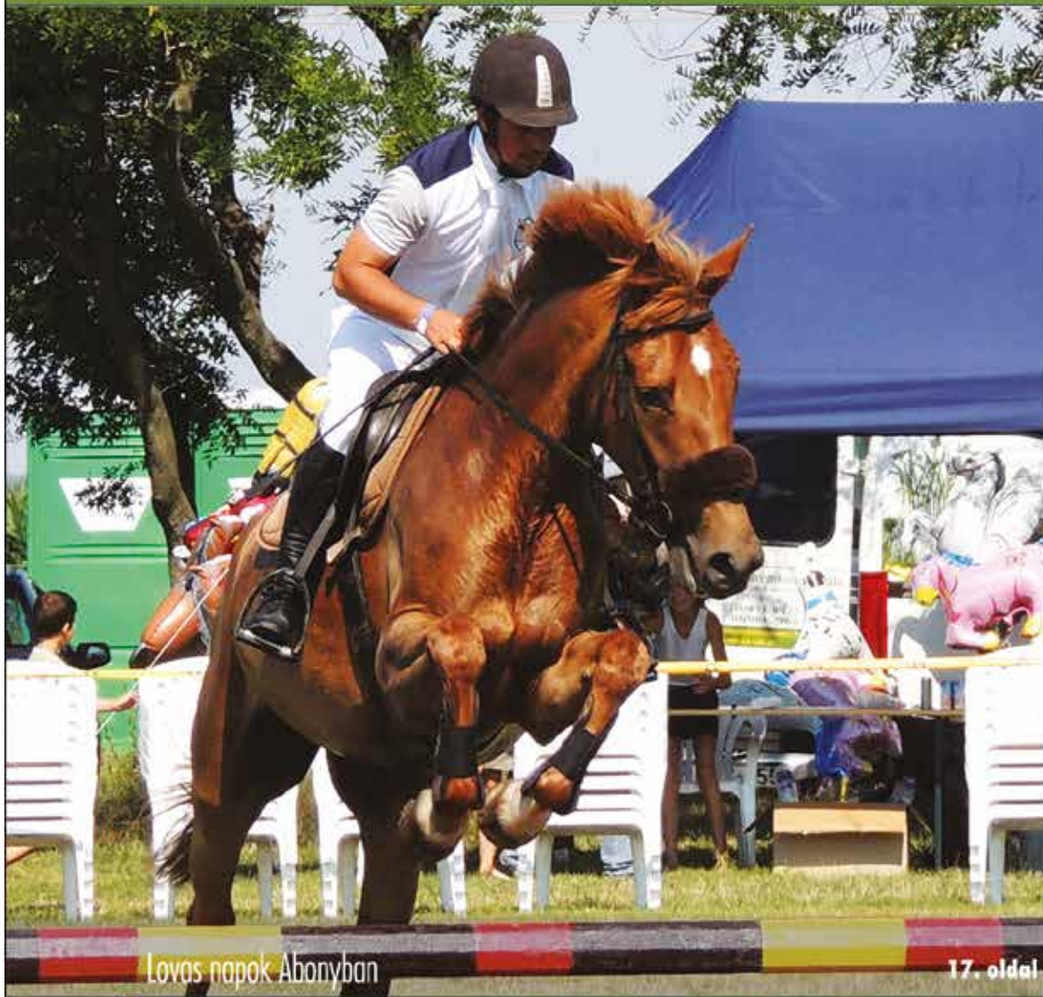
Lovas napok Abonyban

Nagykőrös - Abony - Cegléd - Csemő - Jászkarajenő - Kocsér - Körösetetlen - Nyársapát - Törtel