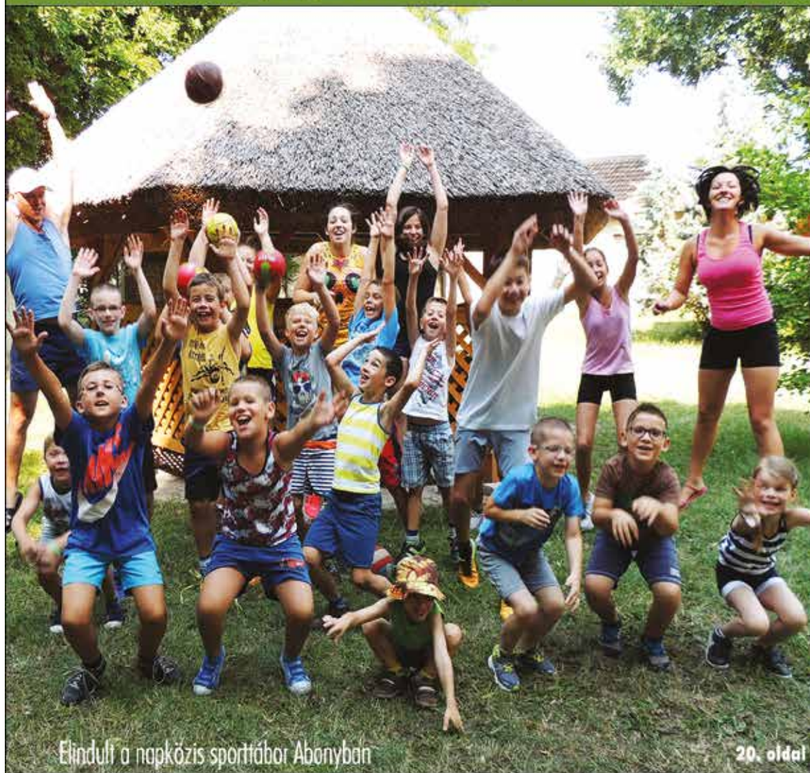
Elindult a napközis sporttábor Abonyban

Nagykőrös - Abony - Cegléd - Csemő - Jászkarajenő - Kocsér - Köröstetétlen - Nyársapát - Törtel