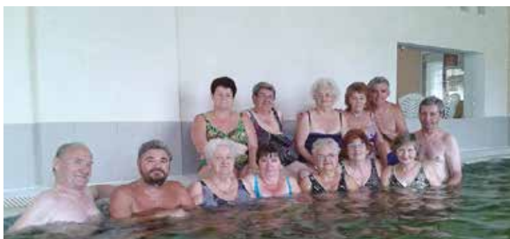
Nosztalgia klub csapatépítő tréningje a nagykörösi strandon.