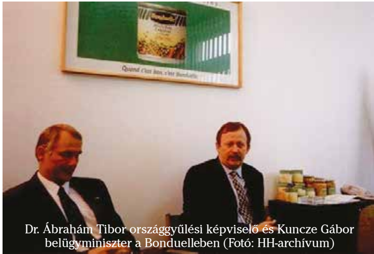
Dr. Ábrahám Tibor országgyűlési képviselő és Kuncze Gábor belügyminiszter a Bondulleben

és ahogy tudom, ráadásul nem is Nagykörösön élt, az utóbbi hónapokban mégis meglepő merészséggel vájkál a város múltjában és mond erkölcsi ítéleteket olyan emberekről, akiket nem ismer, városépítő munkásságukról halvány fogalma sem lehet. Irigylésre méltó magabiztossága példa lehet mindenki számára, aki röhejes bábfigura szeretne lenni az