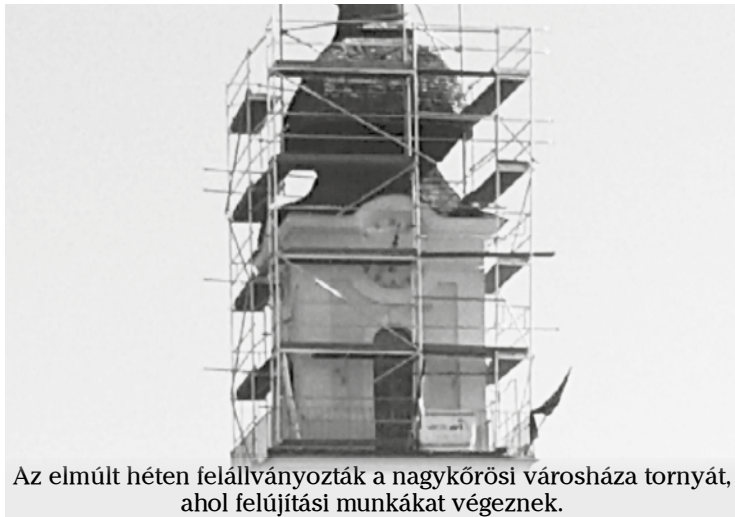
Az elmúlt héten felállványozták a nagykőrösi városháza tornyát, ahol felújítási munkákat végeznek.