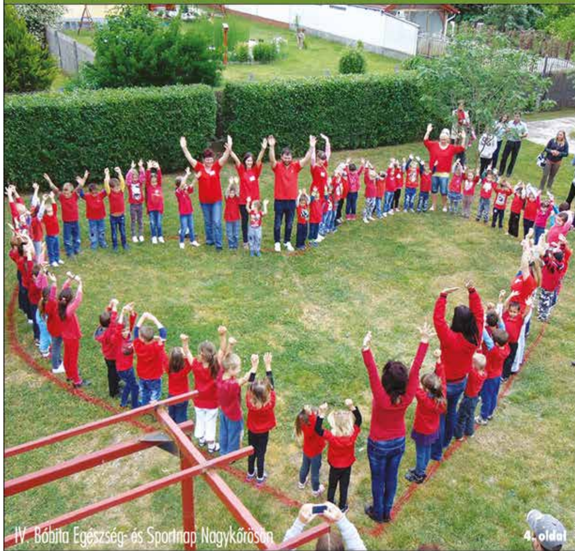
IV. Bóbita Egészség- és Sportnap Nagykőrösön

Nagykőrös - Abony - Cegléd - Csemő - Jászkarajenő - Kocsér - Körösetetlen - Nyársapát - Törtel