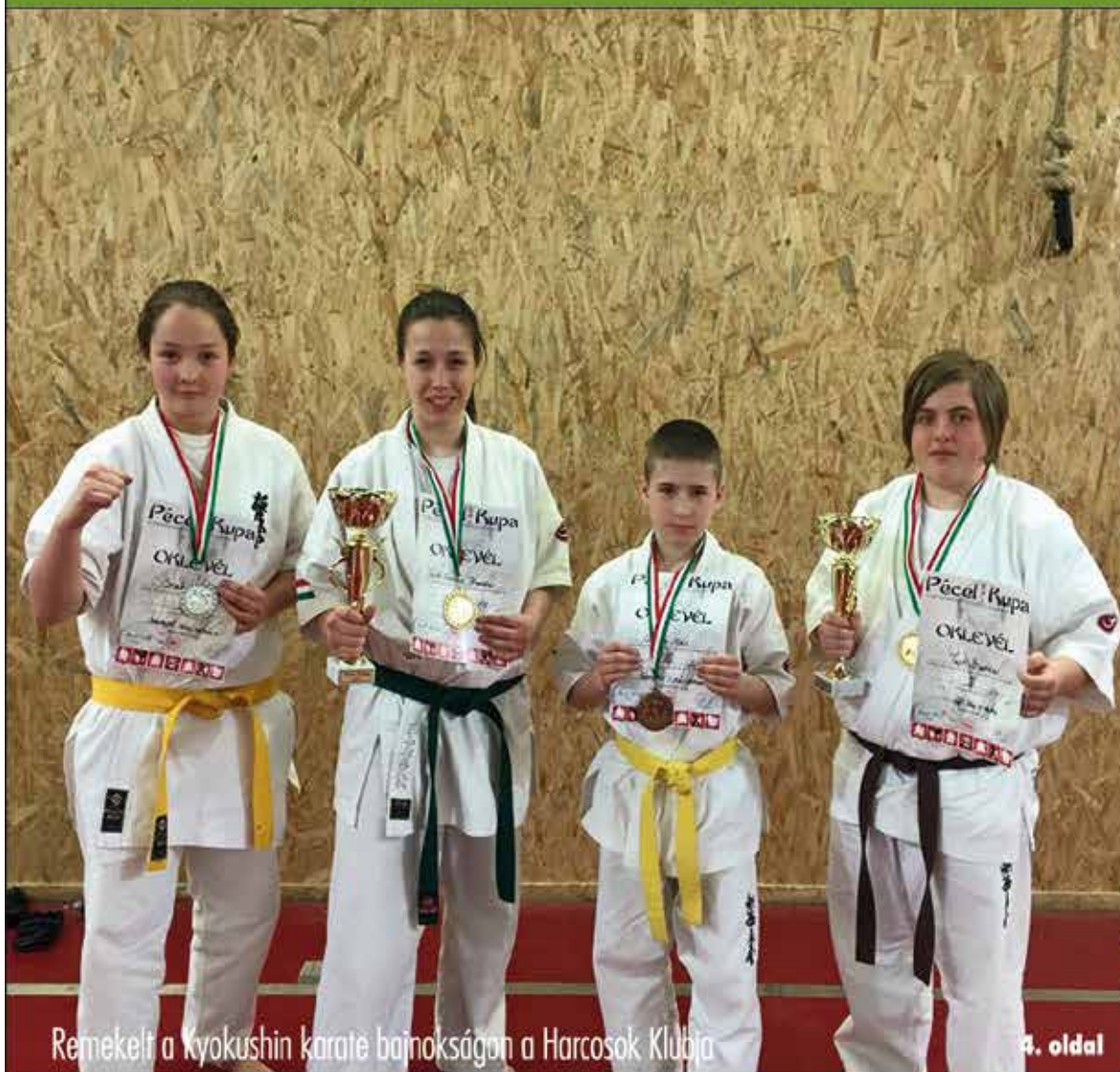
Remekelt a Kyokushin karate bajnokságon a Harcosok Klubja

Nagykőrös - Abony - Cegléd - Csemő - Jászkarajenő - Kocsér - Körösetetlen - Nyársapát - Törtel